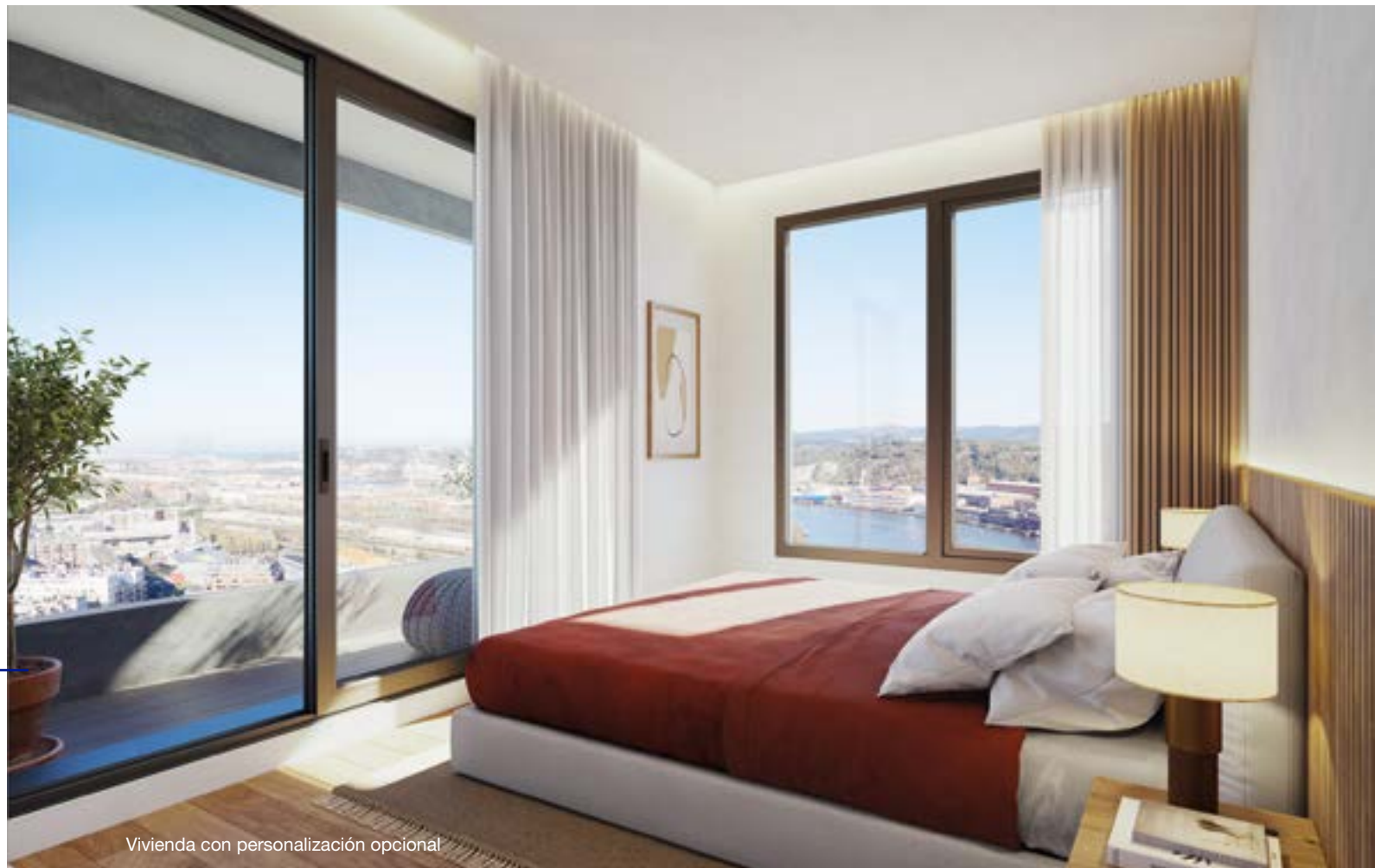
Vivienda con personalización opcional

Gracias a su diseño y orientación, instalaciones de alto rendimiento y un correcto aislamiento de los materiales de fachada y cubierta, Residencial TORRE INBISA gozará de una CALIFICACIÓN ENERGÉTICA A , lo que garantiza la eficiencia energética del edificio y el consiguiente ahorro en calefacción y agua caliente sanitaria.